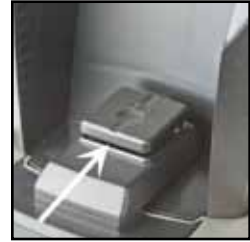
Photo #10 De kleine opening onder het weegplatform MOET vrij zijn van koffiemaassel.

Als het display niet goed optelt wanneer koffie wordt gemalen, verwijder dan het bakje voor gemalen koffie en blaas lucht onder het weegplatform om koffiemaassel te verwijderen uit de nauwe spleet onder het platform. Gebruik GEEN ENKEL type gereedschap onder het weegplatform (zie foto #10).